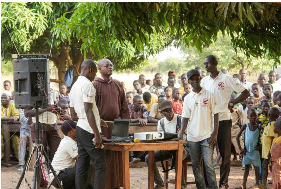
franciscanen in Benin

De VN zelf is een complexe organisatie waarin talloze diplomaten, ambtenaren en andere deskundigen zich bezighouden met een breed scala aan problemen – soms urgent, maar vaak ook met een tijdlijn die zich over decennia kan uitstrekken. Om dit te kunnen doen zijn ze vaak afhankelijk van non-gouvernementele organisaties zoals Franciscans International, die informatie verzamelen of expertise leveren. Vooral in gevallen dat regeringen mensenrechtenschendingen proberen te bagatelliseren, kan feitelijke informatie van buitenaf cruciaal zijn om te weten wat er echt aan de hand is.