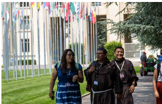
franciscanen bij de VN

Dit idee vond een grote weerklink onder zijn zusters en broeders. In de jaren tachtig was er een groeiend besef dat veel van de uitdagingen die ze ervoeren in de gemeenschappen waarin ze leefden en werkten, niet op zichzelf stonden. Toen broeder Dionysius voorstelde dat ze deze problemen aan de orde zouden moeten stellen bij de Verenigde Naties, klonk dit voor velen als een logische vervolgstap van het werk dat ze al deden met de commissies voor Gerechtigheid, Vrede en Eerbied voor de Schepping.