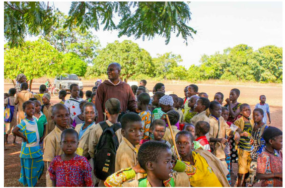
franciscanen in Benin

hun geboorte gedood. Franciscanen proberen al decennia om zoveel mogelijk ‘tovenaarskinderen’ te redden, vaak door directe interventies met de families of beulen. Maar telkens als ze probeerden om de structurele oorzaken van het probleem aan te pakken kregen ze geen steun van de autoriteiten.