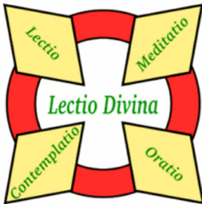
klassiek model voor Lectio Divina

sculptuur, dans, tuinlandschap, nemen als basis voor de contemplatieve dialoog.