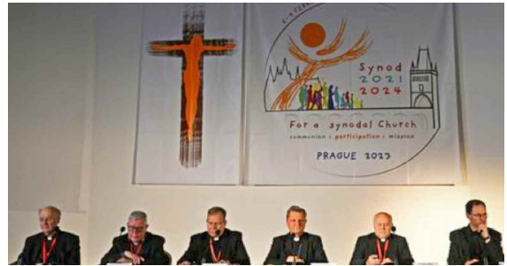
het presidium bij de continentale fase in Praag, op de achtergrond het logo.

Voor de samenkomsten van onze broederschappen is op het ogenblik de uitwisseling / het geloofsgesprek het belangrijkste element. Zeer interessant om stil te staan bij deze methode in Praag. De 39 vertegenwoordigers kregen ieder drie minuten om met de anderen te delen over wat er leeft in de geloofsgemeenschap van de kerk in hun land. Drie minuten, niet meer en niet minder, over wat er leeft / waar het gemoed wordt geraakt / waar jouw gezicht zichtbaar wordt. En daarna was er een volle minuut stilte! Alle toehoorders konden de woorden laten bezinken, het geheel overzien en dus ook de ervaringen in een context verstaan. Alle toehoorders konden stil zijn bij de woorden, en invoelend merken hoe het resoneerde met hun eigen verhaal (in contrast of instemmend). Eén minuut om te zwijgen, te mediteren, één minuut om de woorden te dragen in gebed. Na iedere drie sprekers (inclusief de minuut) was er een kort moment voor eerste reacties binnen iedere conferentie-groep; even onder elkaar de eerste reacties laten klinken. Zo ging er steeds een kwartier voorbij, en dat 13 keer. Daarnaast waren er ook gesprekken in subgroepen en het grote plenum, er waren de ontmoetingen per taalgroep als ook in de wandelgangen en de eetzaal. Natuurlijk waren er tussen sommige deelnemers zeer grote verschillen van opvatting (de positie van vrouwen, de waarde van de wijding, etc.), maar eenieder was getroffen door de sfeer van aandachtig luisteren als basis voor de uitwisseling.