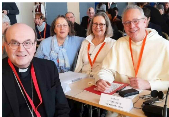
Nederlandse delegatie bijeenkomst Praag

Met groot enthousiasme werd na afloop door alle deelnemers gesproken over een spirituele bijeenkomst. Er was een evenredige vertegenwoordiging van alle geleidingen van alle geledingen in de kerk. Dus niet enkel de 'gezagsdragers' of de 'professionals' (bisdome medewerkers + religieuzen), maar ook van katholieke organisaties en lekenbewegingen. En dus mannen en vrouwen. Enkel jongeren waren afwezig, maar die zijn haast op geen enkele plek in de kerk te vinden en daarmee moeilijk te vertegenwoordigen (dit is voor de toekomst dus een enorme uitdaging voor de gehele geloofsgemeenschap). Het meest bijzondere van de Europese uitwisseling was de werk-